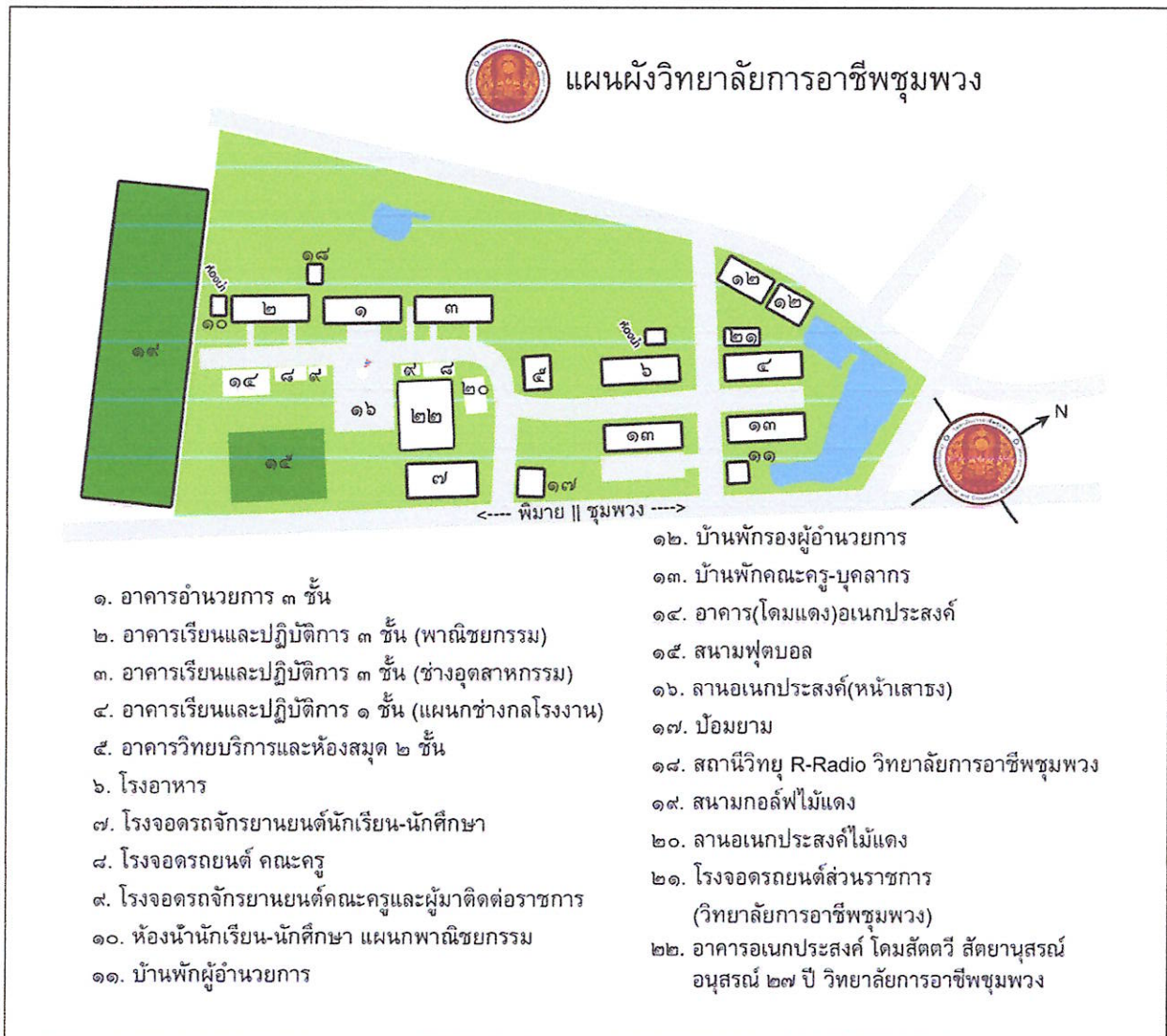
ภาพที่ ๑ : แสดงแผนผังวิทยาลัยการอาชีพชุมพวง

ที่ตั้ง : ถนนพิมาย-ชุมพวง อำเภอชุมพวง จังหวัดนครราชสีมา